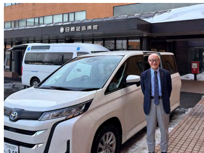
日鋼記念病院 緩和ケア病棟

最近M&Aという言葉をよく耳にします。M&Aとは、「Mergers and Acquisitions(合併と買収)」の略です。事業の拡大や後継者不足問題の解決、経営の効率化を目的として現在では前向きに行われることが多くなってきました。医療の分野も例外ではなく、昨年(2025年)1年間に11の病院、2月に札幌真駒内病院(北海道)、野田総合病院(千葉県)、4月には医療法人社団 空と海の大崎病院 東京ハートセンターと東京蒲田病院(ともに東京都)、7月には正和病院(大阪市)、9月に医療法人社団晃悠会のむさしの救急病院(東京都)とふじみの救急病院(埼玉県)、10月には公立種子島病院(鹿児島県)、北海道の社会医療法人母恋の日鋼記念病院(室蘭)、登別記念病院(登別)、天使病院(札幌)が徳洲会グループの仲間入りをして令和8年3月の時点で合計90病院となりました。このスケールメリットを活かしながらそれぞれの地域のニーズにあった医療を提供していく必要があります。既存の施設を維持し、発展させながら同時に行うことは容易ではありませんが、皆んなで力を合わせて頑張っていきたいと思えます。